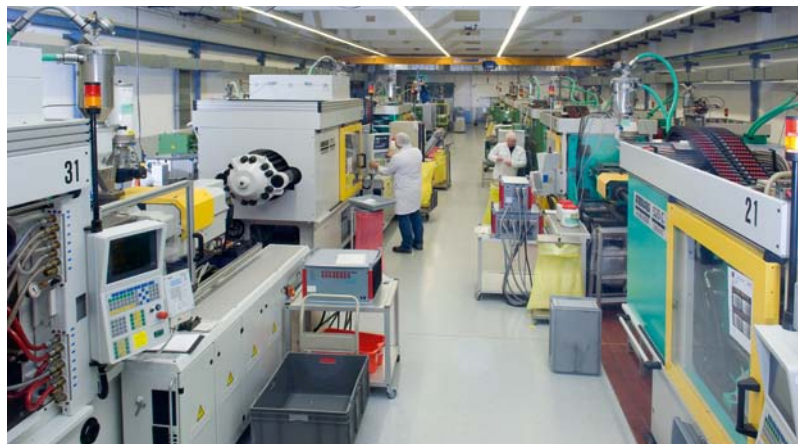
Unsere Produktionshalle am Standort Ansbach. Our production hall at Ansbach.