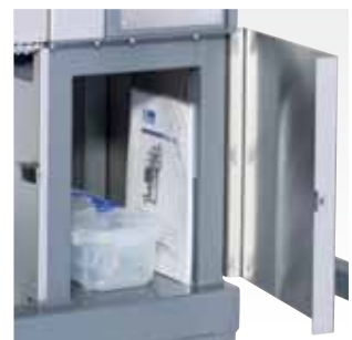
収納スペースの確保