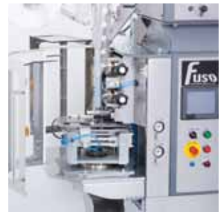
高い操作性及びメンテナンスの向上