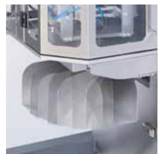
向き可変式 排出シュート